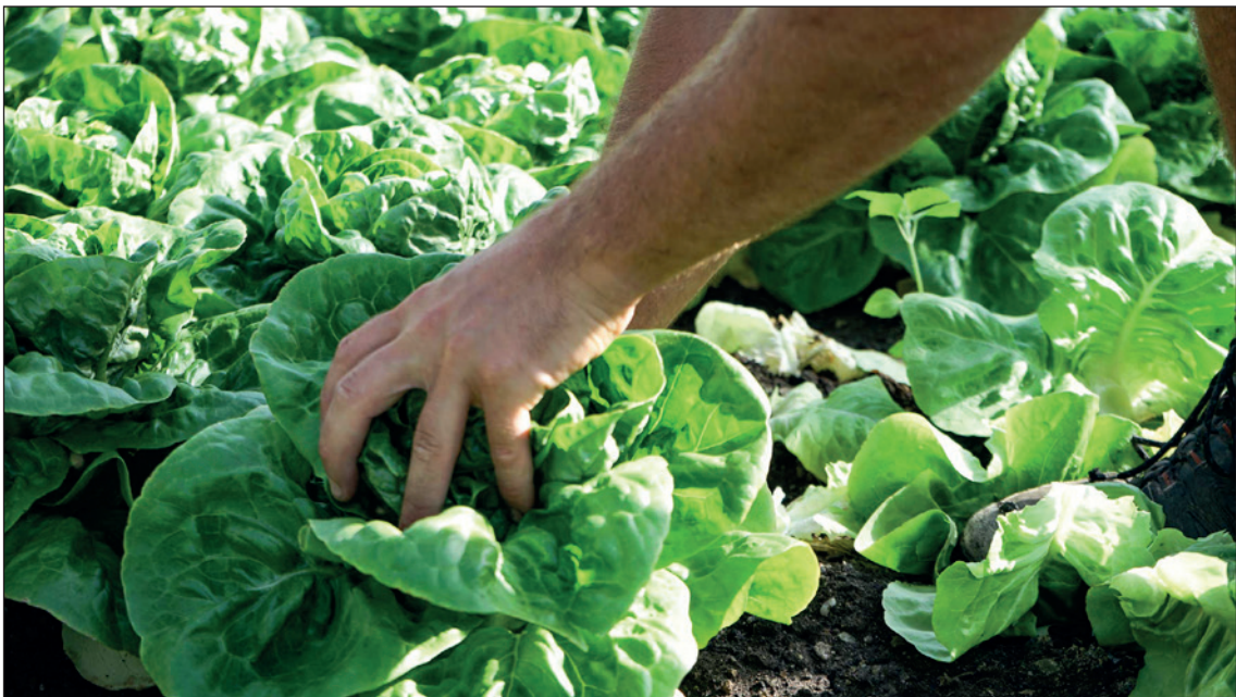
Im Gemüsebau ist viel Handarbeit gefordert.