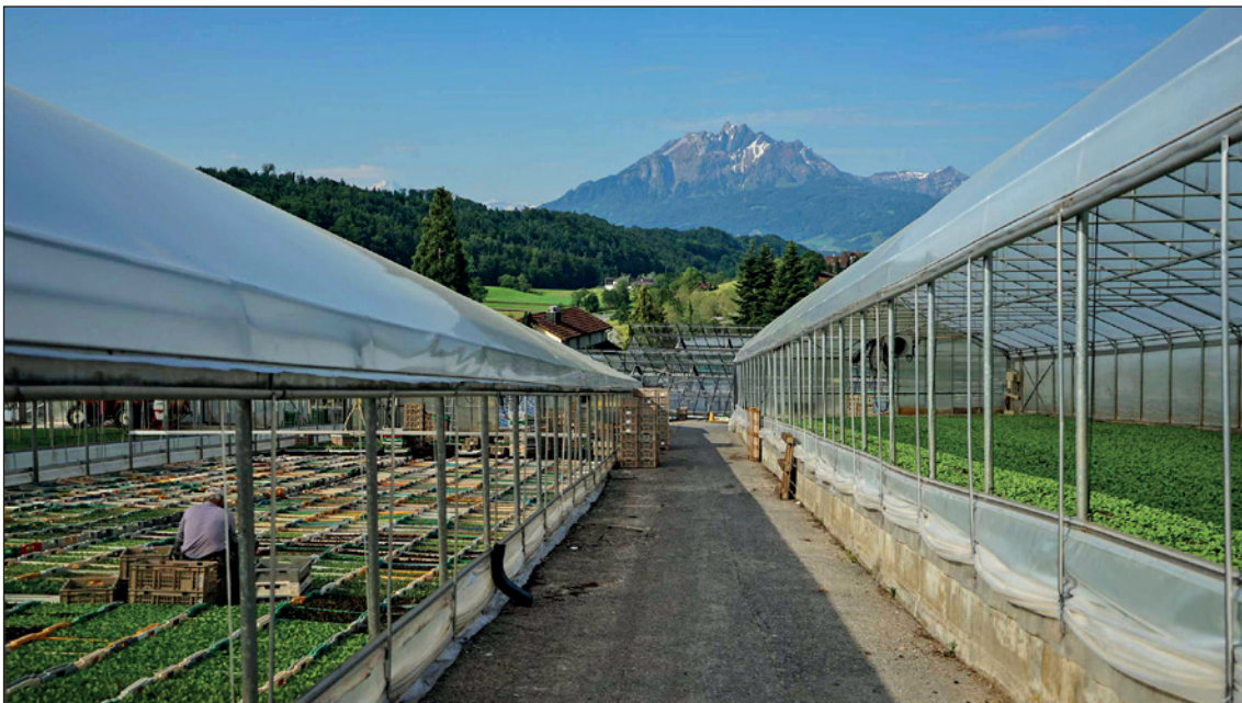
Die Kilian Gemüse GmbH produziert in Udligenswil ausschliesslich in Gewächshäusern.

Die Zusicherung von Agrarkrediten lag im Jahr 2025 mit CHF 49.2 Mio. erneut auf einem sehr hohen Niveau. Im Berichtsjahr wurden Investitionskredite in Höhe von CHF 1.8 Mio. mehr als im Vorjahr gewährt. Auch die Betriebshilfedarlehen nahmen um CHF 0.5 Mio. zu und beliefen sich neu auf CHF 3.1 Mio. Hingegen halbierte sich die Gewährung kantonaler Agrarkredite gegenüber dem Vorjahr von CHF 3.6 Mio. auf CHF 1.8 Mio.