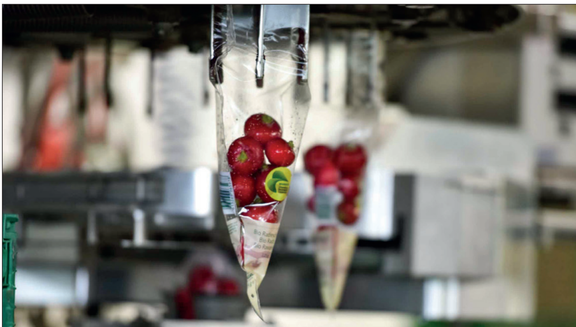
Die Abfüllung der Radieschen erfolgt auf dem Betrieb Kilian Gemüse GmbH vollautomatisch mit modernsten Maschinen.

Im Januar 2026 prüfte die zuständige Revisionsstelle die Jahresrechnung sowie die Geschäftstätigkeit der Bürgschaftsstiftung und des Amortisations- und Zinsbeihilfefonds gemäss den Vorgaben der eingeschränkten Revision. Der Prüfungsbericht mit den entsprechenden Empfehlungen und Anträgen ist nachfolgend veröffentlicht.